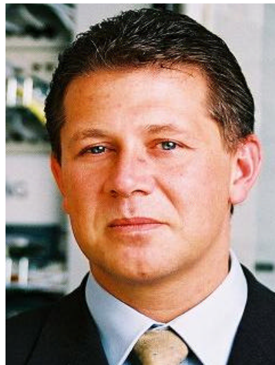
Die net Stemmer und Ihre Hersteller stehen für Innovation und Zuverlässigkeit